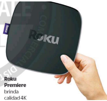
Roku Premiere brinda calidad 4K

Una novedad es el poder escuchar el audio de la pantalla desde el celular, a través de una app móvil que también funciona como control. ●